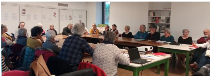
Assemblée générale du lundi 20 mars

Merci de prendre contact pour connaître les fournitures nécessaires.