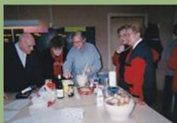
Echange « Cake aux olives- 2000