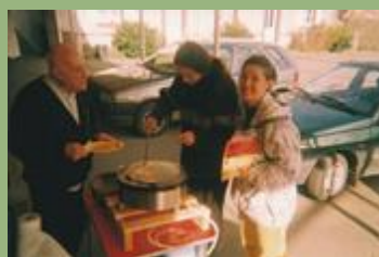
Echange « faire des ga- lettes sur un billig » - 2000